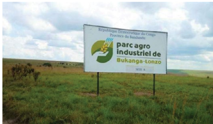
Entrée du parc

Lokola esangami na mangomba oyo esungaka basali bilanga, na esika ya kozwa mabele ya baimboka mpo na kotombola nkona mpo na mombongo na bilanga minene-minene ya mombongo, esengeli kopesa biyano na mposa ya basali ya bilanga, ndakisa makoki ya kozwa milona ya malamau et ndenge ya kodefa misolo too biloko mosusu ya mosala ya bilanga, mpe lisungu komema mbuma ya bilanga