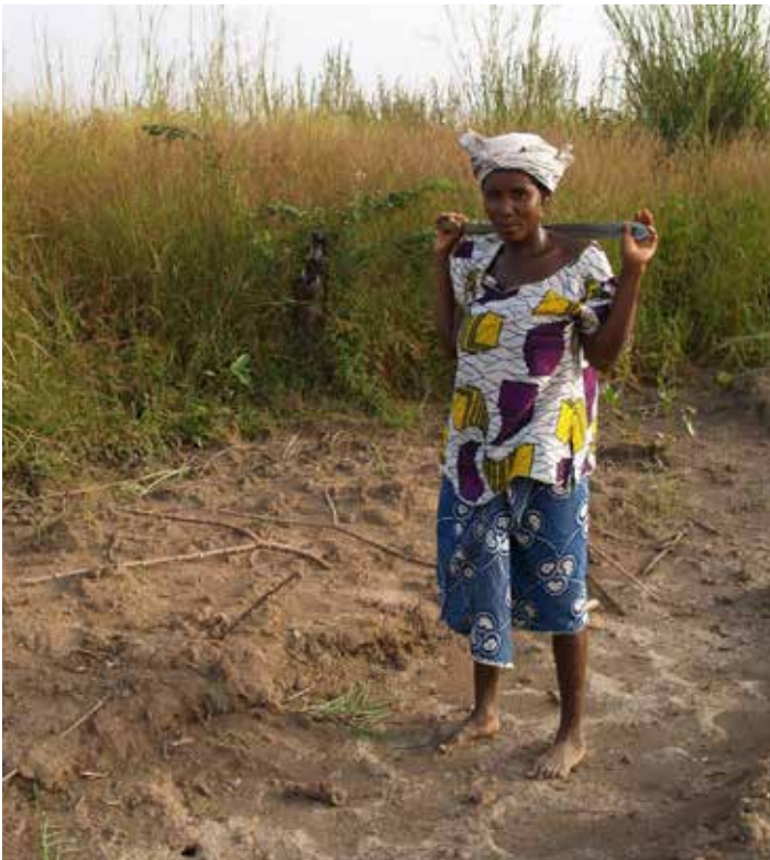
Paysanne de Sierra Leone sur les terres acquises par une entreprise suisse