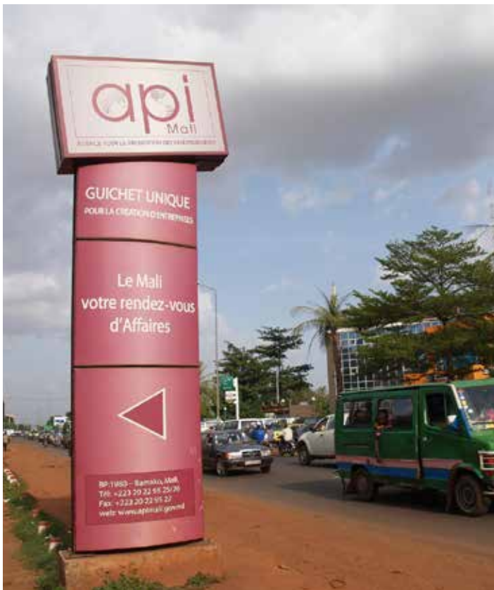
Panneau de l'Agence de Promotion des Investissements à Bamako, Mali.