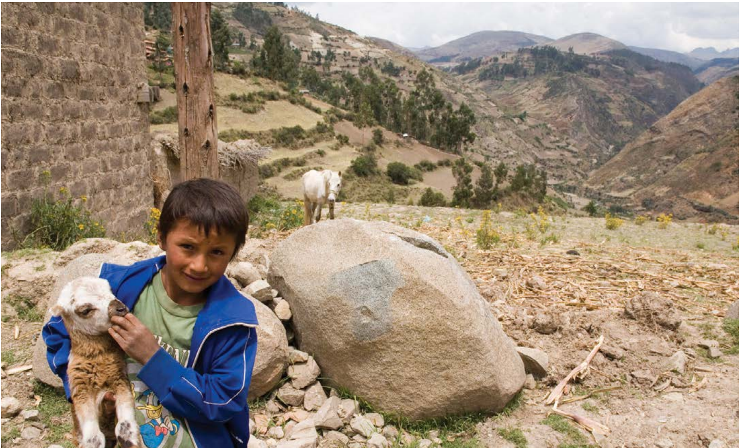
Niño cuida a una oveja en Taipicha, cerca de Turpo.

gobierno. Ante la volatilidad de los precios agrícolas, los altos costos de agua y el endeudamiento, 65 carecen de asistencia técnica, sistemas de créditos agrícolas y ayuda del gobierno para acceder a los mercados. 66 En 2011, el presidente del gobierno regional de Ica, Rómulo Triveño, justificó esta decisión por el hecho de que “los pequeños agricultores no tienen una agricultura tecnificada, no trabajan sus tierras adecuadamente. Son más bien pobres con tenencia de tierra, una tierra que no están aprovechando por falta de conocimientos y recursos. Mejor es que arrienden o incluso vendan.” 67