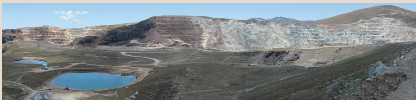
El tajo Maqui Maqui, Cajamarca, 2005.

Minera Yanacocha S.R.L. es una empresa conjunta de la compañía estadounidense Newmont Mining Corporation (51,35 por ciento), la compañía peruana Minas Buenaventura (43,65 por ciento) y la CFI (5 por ciento). Hace 23 años que Yanacocha opera en la región de Cajamarca, en la sierra norte de Perú.