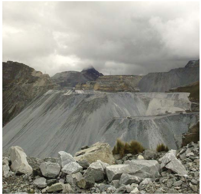
Mina Antamina, distrito de San Marcos, 2006.

Mediante el OMGI, su otra filial del sector privado, entre 1999 y 2000 el Banco Mundial proporcionó seis garantías por un total de 107,5 millones de dólares para apoyar el proyecto minero Antamina, propiedad de una joint venture integrada por el consorcio suizo Glencore, la australiana BHP Billiton, la canadiense Teck Cominco y Mitsubishi Corporation de Japón. 46 Este financiamiento del OMGI a la Compañía Minera Antamina también dio lugar a varias quejas ante el CAO que denunciaban el proceso de reasentamiento de las familias propietarias de los terrenos donde se construyó la