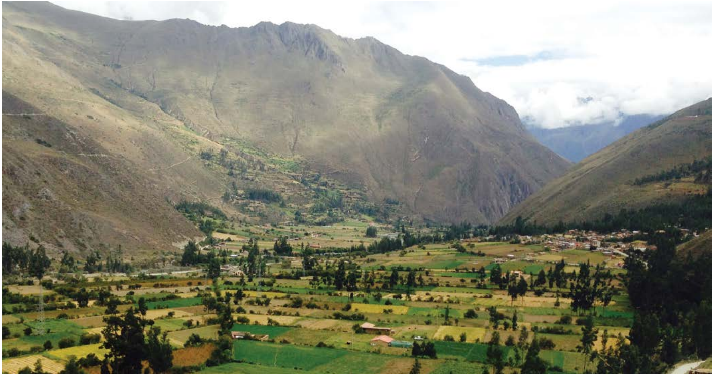
Paisaje agrícola en Moray, Perú, 2015.

En octubre de 2015, Perú será sede de las Reuniones Anuales del Fondo Monetario Internacional (FMI) y el Banco Mundial, que tendrán lugar en América Latina por primera vez en más de 40 años. 1 Las instituciones de Bretton Woods, criticadas por su historial de rebajar los estándares sociales y ambientales, quieren promover el “éxito” de sus políticas y reformas neoliberales en Perú ante el resto del mundo. 2