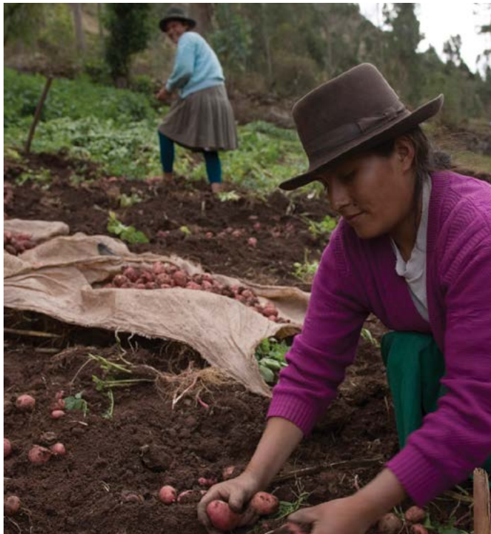
Cosechando patatas en Manchaybamba, Andahuayla, Perú.

Para una institución con el mandato de luchar contra la pobreza, el apoyo del Banco Mundial a las industrias extractivas plantea varias preguntas. Los ingresos de la industria minera apenas benefician a las poblaciones de las regiones donde las minas prosperan. El distrito de San Marcos, donde se encuentra Antamina, es uno de los más ricos de Perú con cerca de 50 millones de dólares de ingresos fiscales provenientes de las actividades mineras en 2013. 54 Sin embargo, sufre de inestabilidad política crónica debido a los escándalos de corrupción, carece de infraestructura básica y casi un tercio de los niños menores de cinco años sufren de desnutrición crónica. 55 Otras regiones ricas en minerales tales como Cuzco o Puno, que recibieron 212,5 y 238,6 millones de dólares respectivamente de los impuestos mineros recolectados entre 2006 y 2010, enfrentan similares problemas de pobreza e inseguridad alimentaria. 56